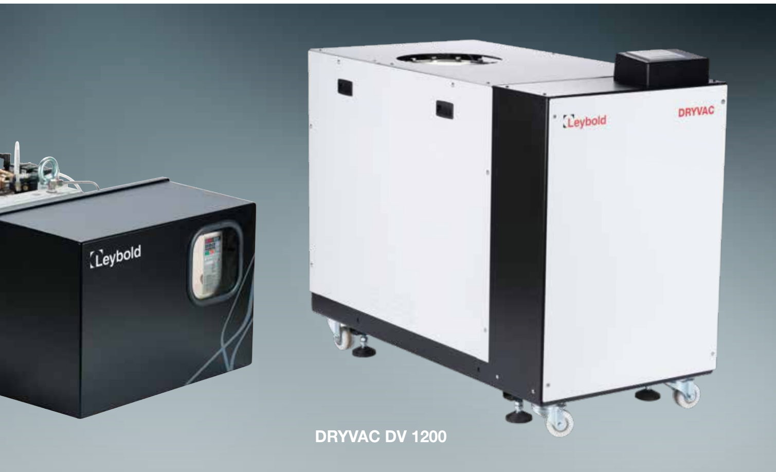
DRYVAC DV 1200